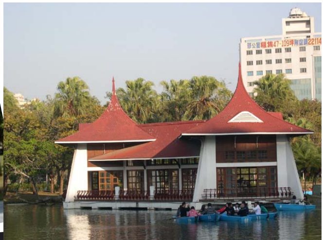
台中公園湖心亭 (日治時期興建)